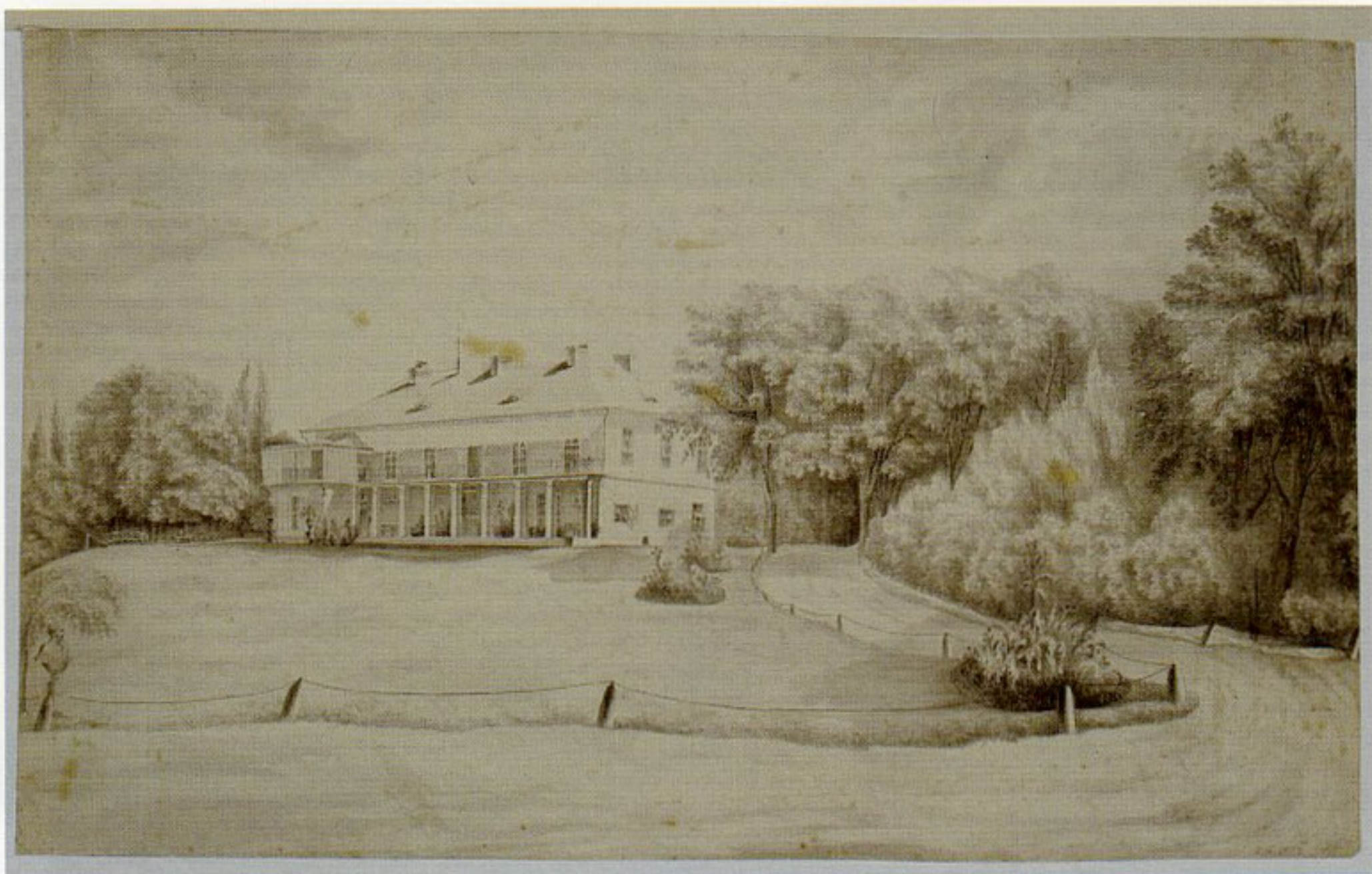
21. Antoni Lange, „Pałac w Przeworsku”, ok. 1825, rysunek akwarelą, w zbiorach Biblioteki Narodowej