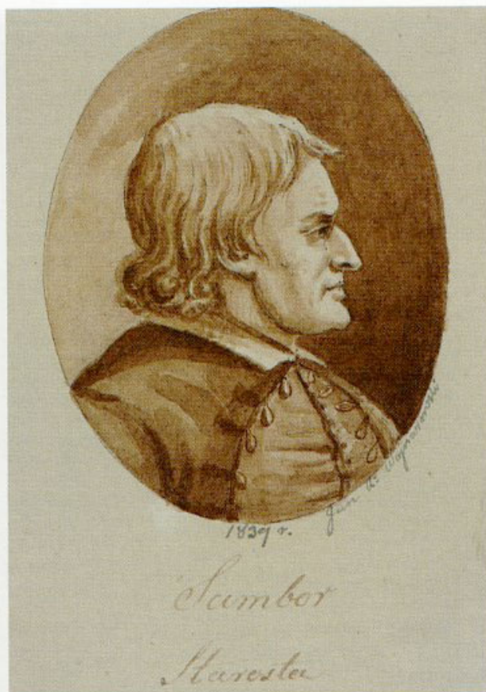
14. Jan Kanty Wojnarowski, „Portret starosty Sambora”, 1839, rysunek sepią, w zbiorach Biblioteki Narodowej