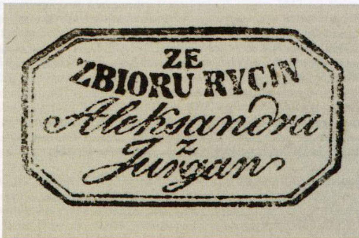
1. Pieczętka własnościowa Aleksandra z Jurgan na odwrocie rysunku nieznanego autora „Widok świątyni Sybilli w Puławach”, ok. 1815, w zbiorach Biblioteki Narodowej