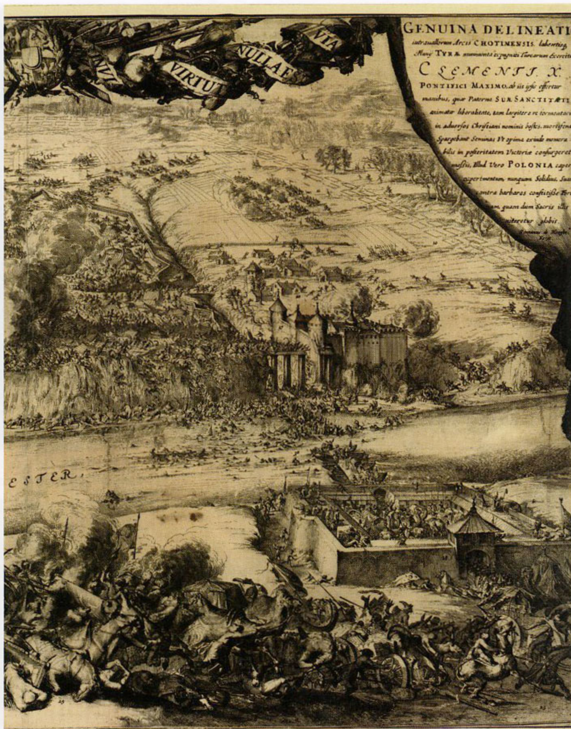
20. Romeyn de Hooghe, „Bitwa pod Chocimem w 1673 r.” (fragment), 1674, akwaforta i miedzioryt, w zbiorach Biblioteki Narodowej