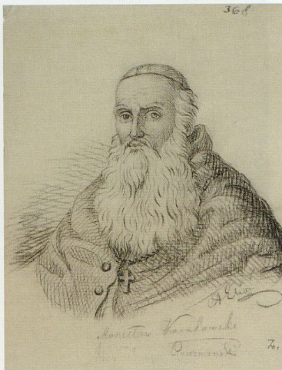
16. Piotr Wroński, „Portret arcybiskupa Stanisława Karnkowskiego”, 1842, rysunek ołówkiem, w zbiorach Biblioteki Narodowej