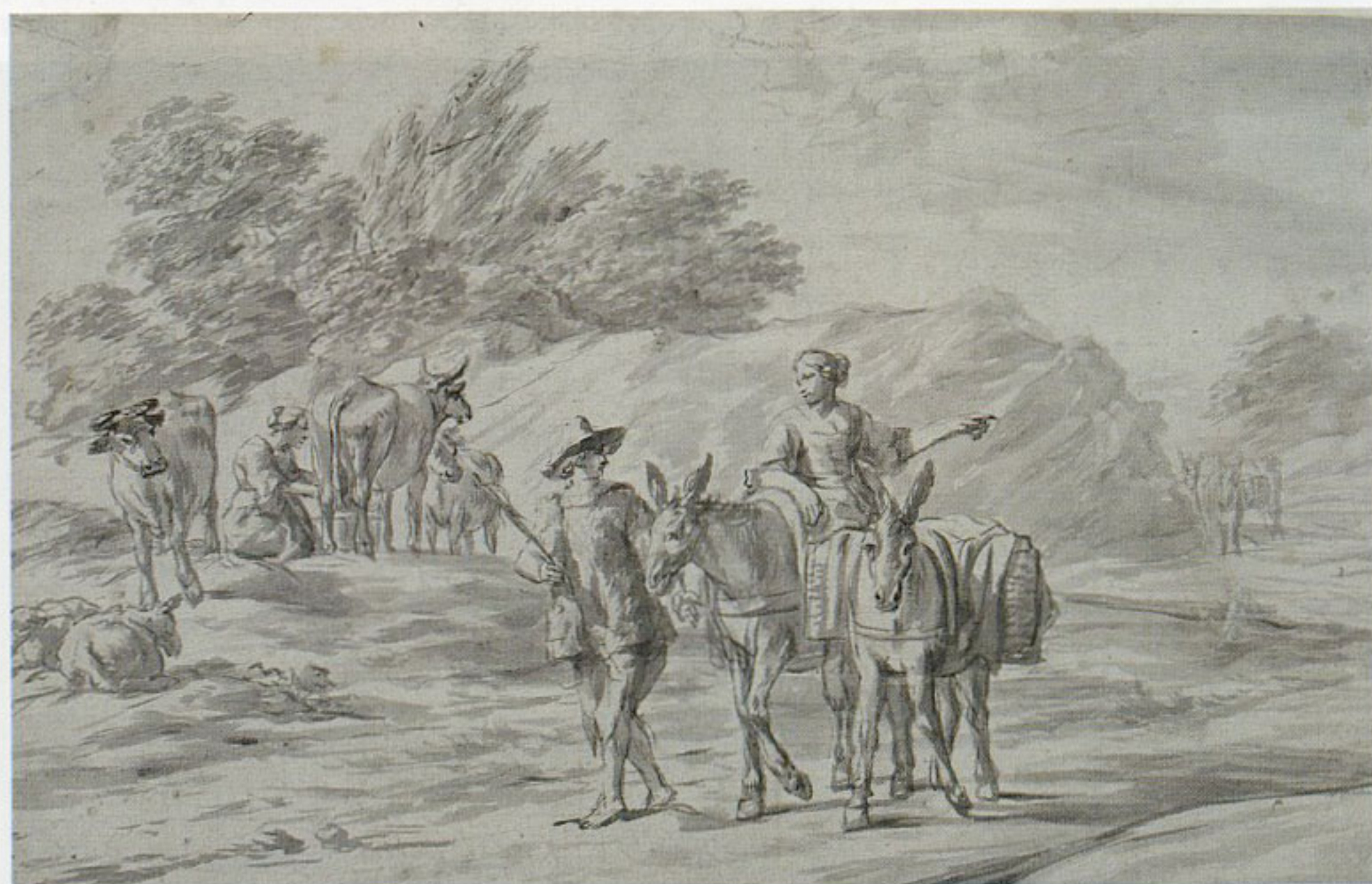
24. Franciszek Ksawery Lampi (?), „Kobieta jadąca na mule”, przed 1849, rysunek tuszem i akwarelą, w zbiorach Biblioteki Narodowej