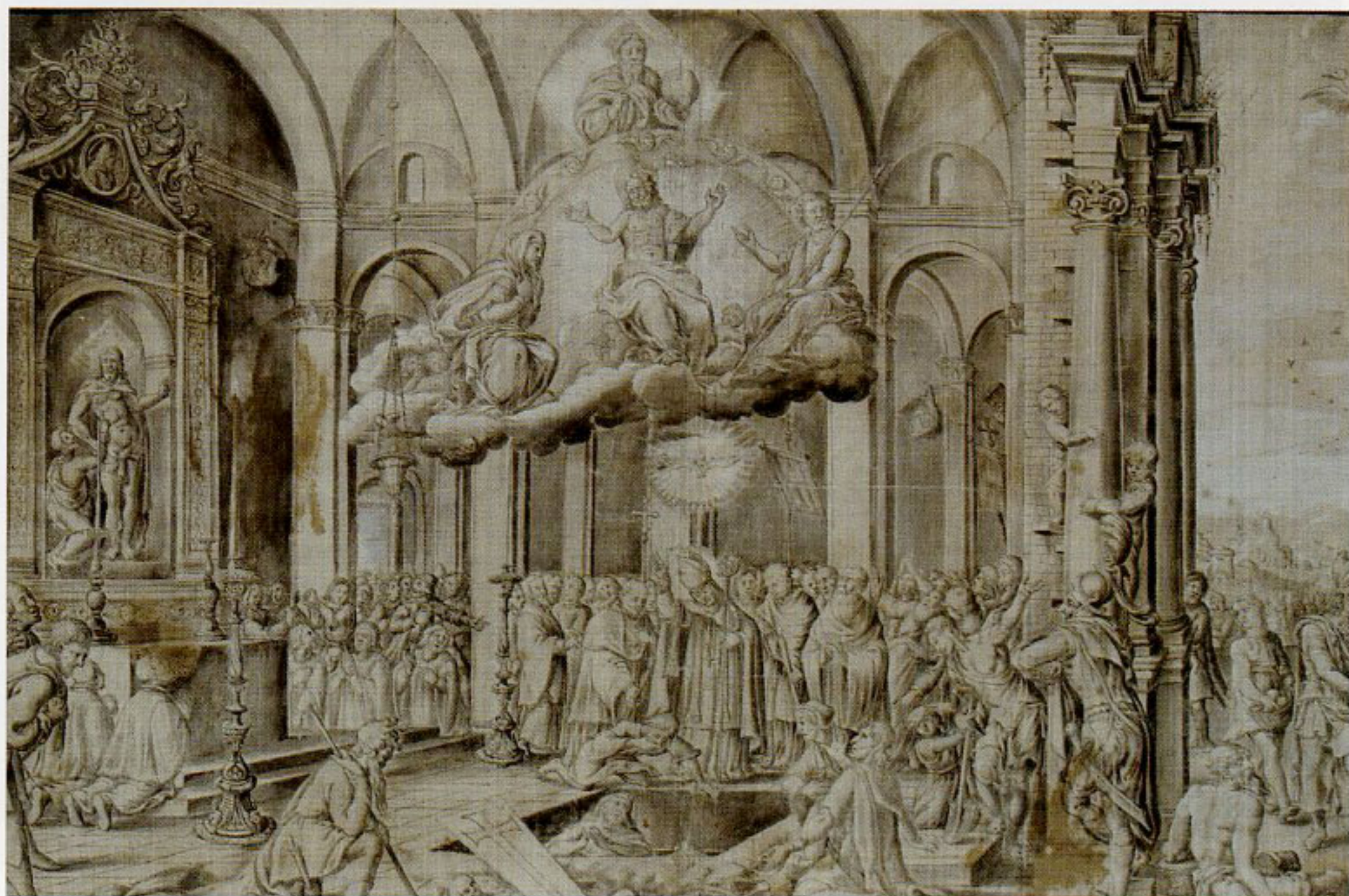
26. Jan Chryzostom Proszowski, „Wskrzeszenie Piotrowina”, 1649, rysunek tuszem, sepią, lawowany w tonie szarym, brunatnym, rozjaśniony bielą, w zbiorach Biblioteki Narodowej