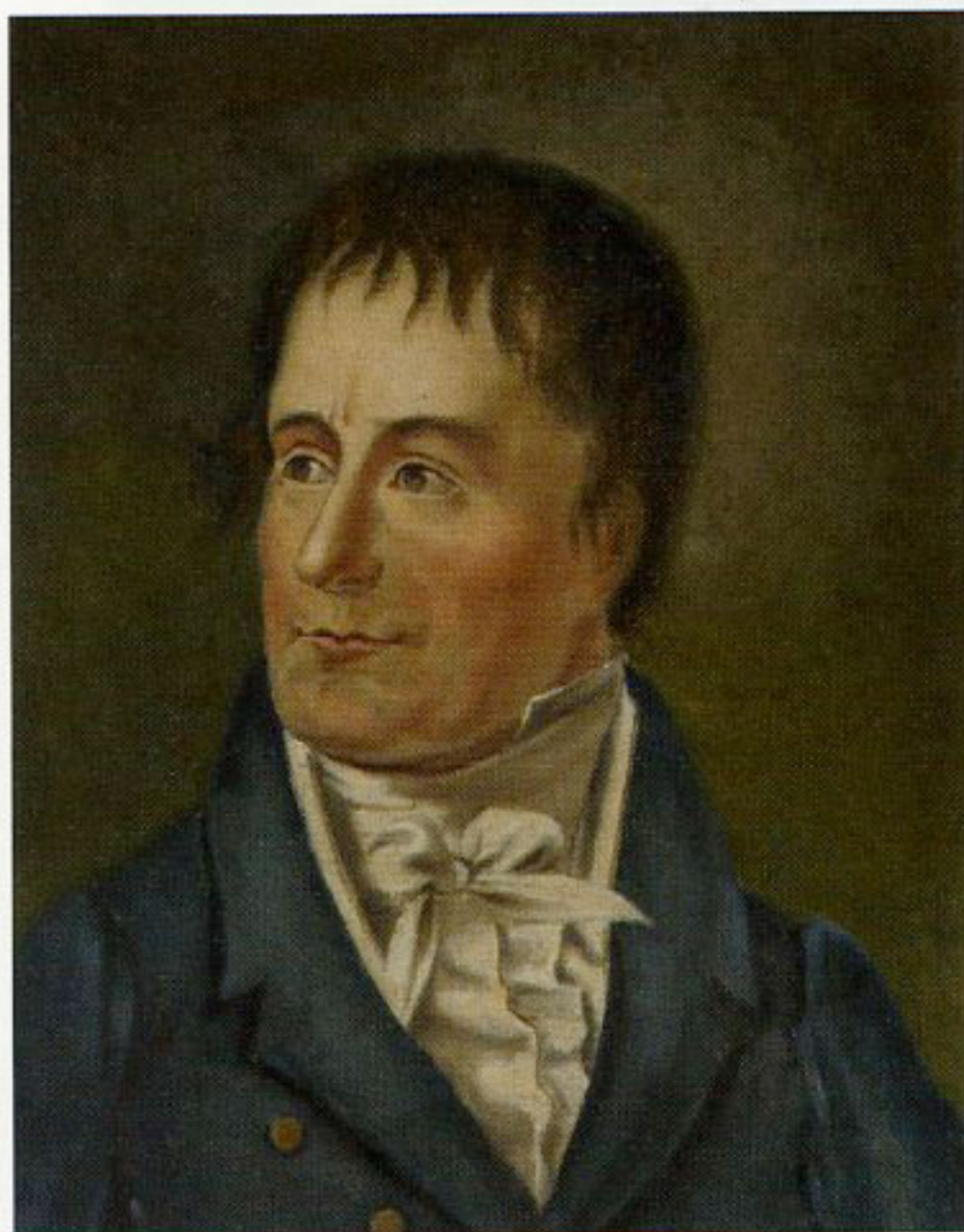
15. Michał Rogowski, „Portret Wojciecha Bogusławskiego”, przed 1849, olej, gwasz na papierze, w zbiorach Biblioteki Narodowej