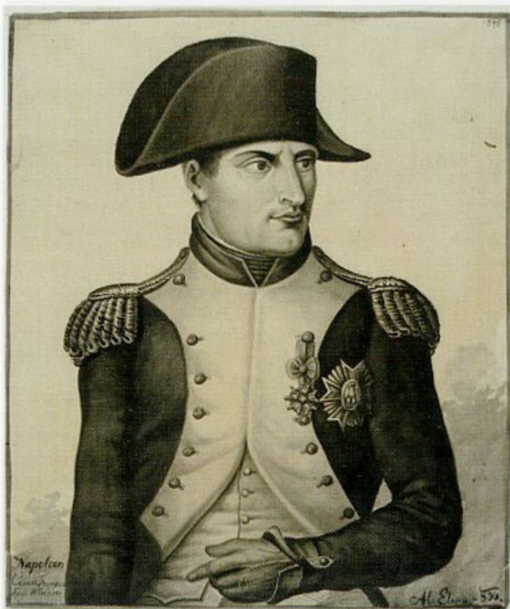
17. Wojciech Elias, „Portret cesarza Napoleona I”, 1836, rysunek tuszem, w zbiorach Biblioteki Narodowej