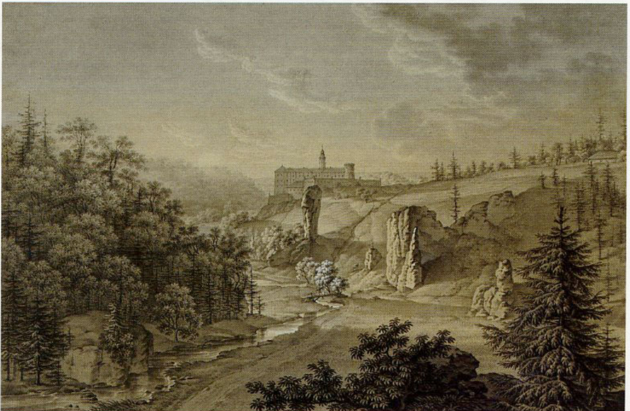
4. Jan Nepomucen Głowacki, „Widok zamku Pieskowa Skała”, 1824, rysunek tuszem, gwaszem i akwarelą, w zbiorach Biblioteki Narodowej