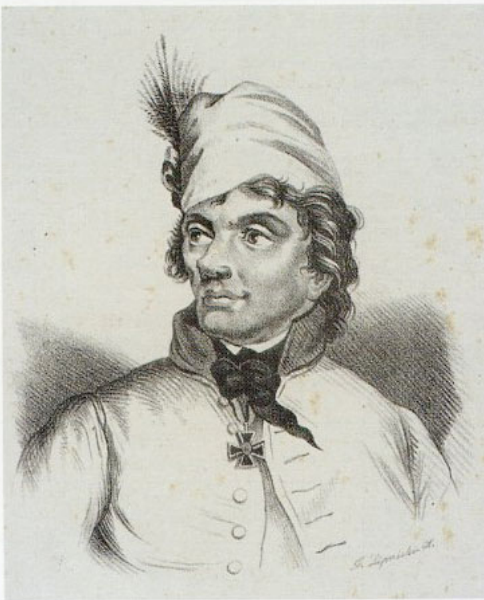
11. Feliks Lipnicki, „Portret Tadeusza Kościuszki”, 1836, litografia, w zbiorach Biblioteki Narodowej