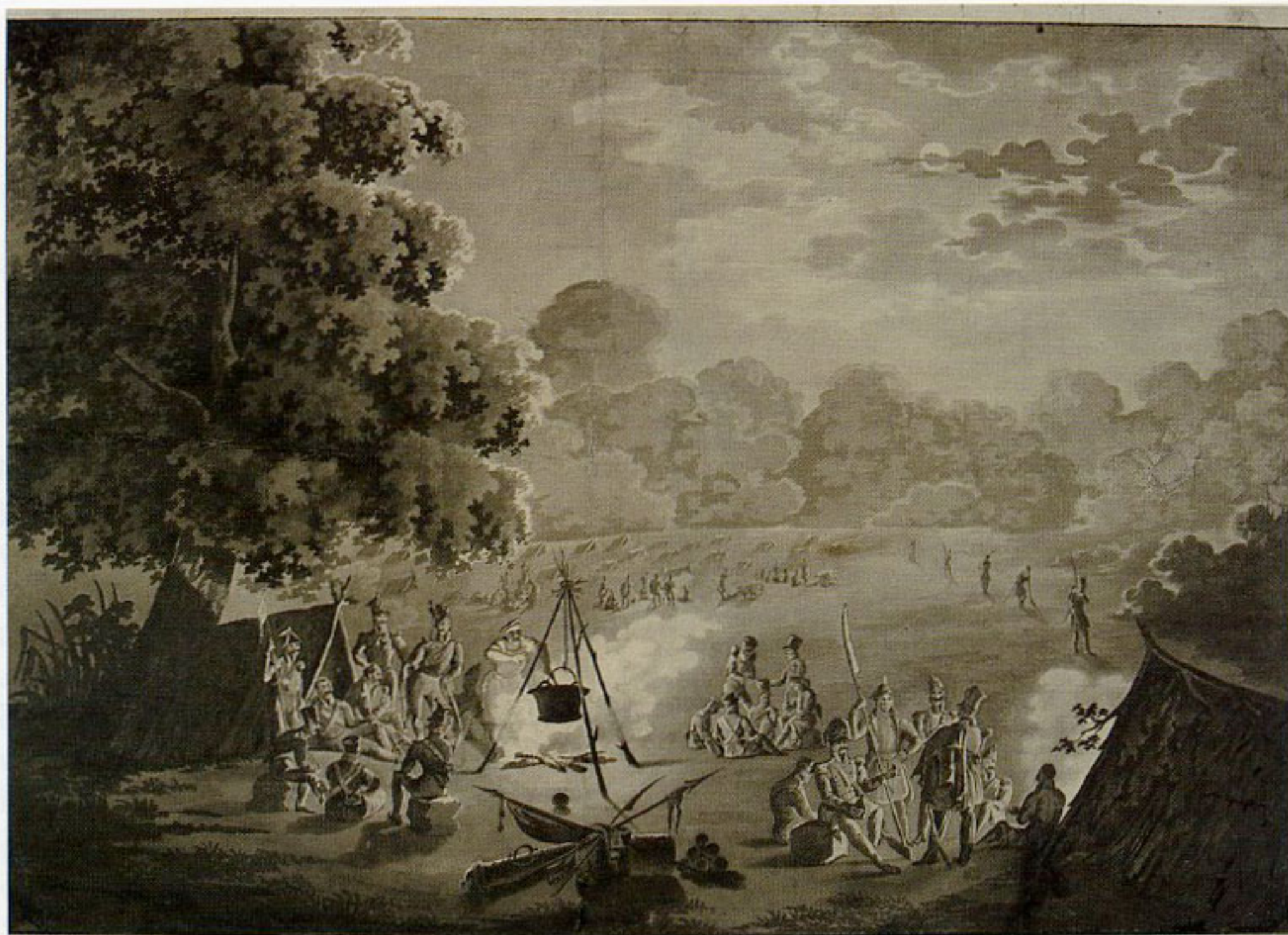
23. Marcin Kuśmierski, „Obóz żołnierski z czasów powstania listopadowego”, 1831, rysunek tuszem, w zbiorach Biblioteki Narodowej