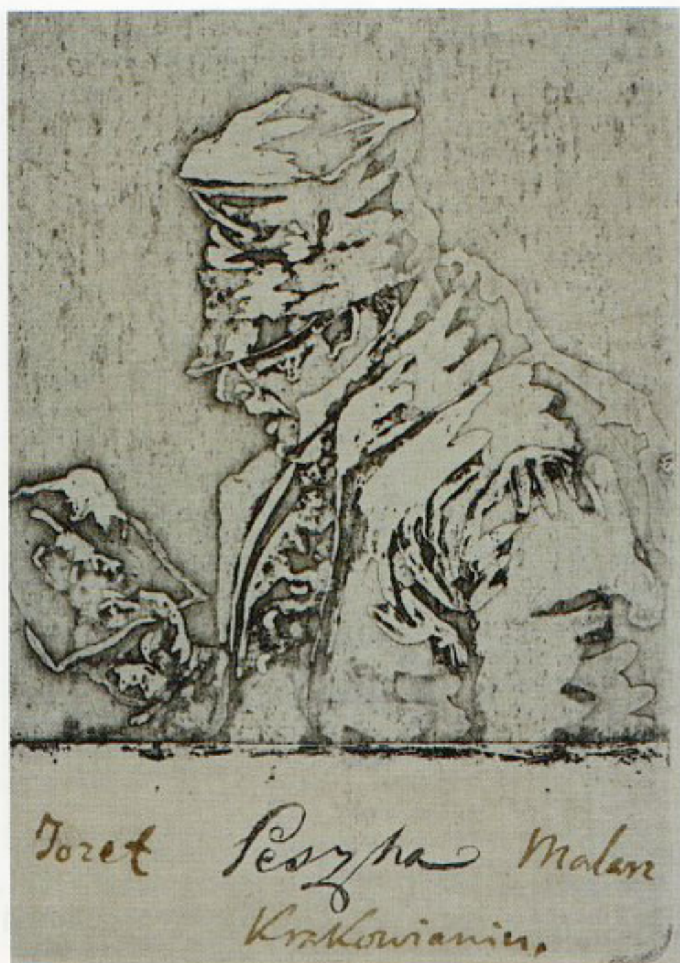
13. Teofil Żebrawski, „Portret Józefa Peszki”, 1836, akwatinta, w zbiorach Biblioteki Narodowej