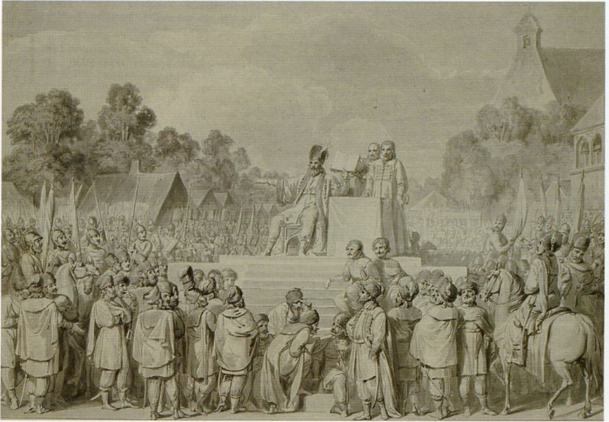
3. Franciszek Smuglewicz, „Sejm w Wiślicy”, przed 1807, rysunek tuszem, w zbiorach Biblioteki Narodowej