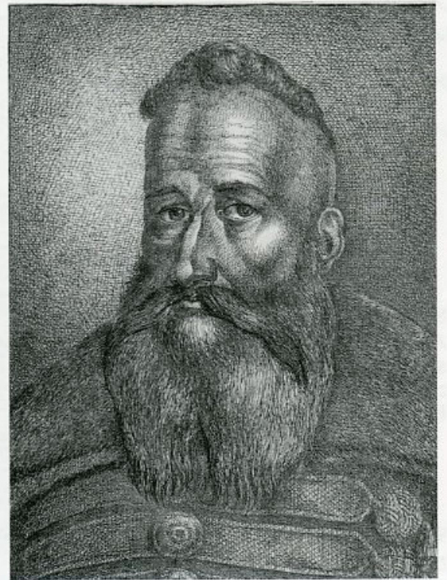
12. Kajetan Wincenty Kielisiński, „Portret Stanisława Koniecpolskiego”, 1837, akwaforta, w zbiorach Biblioteki Narodowej