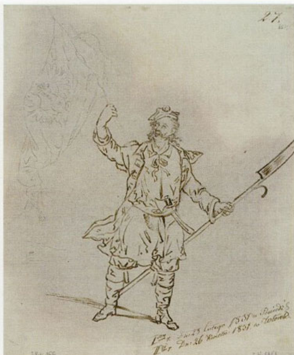
18. Teofil Mielcarzewicz, „Kosynier”, 1831, rysunek tuszem, w zbiorach Biblioteki Narodowej