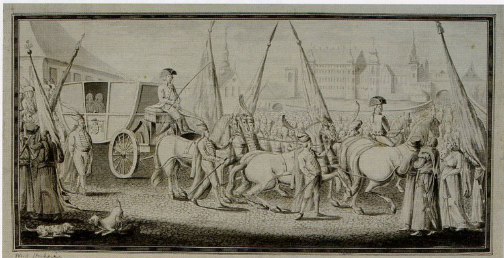
2. Michał Stachowicz, „Wjazd na Wawel biskupa Kajetana Sołtyka w 1759 roku”, ok. 1814, rysunek tuszem, w zbiorach Biblioteki Narodowej