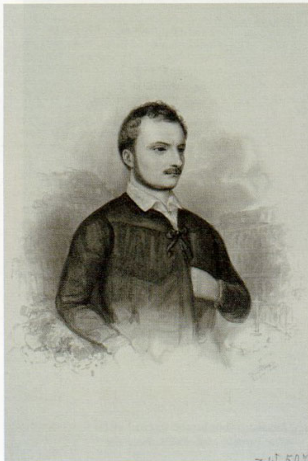
22. Józef Szymon Kurowski, „Portret Zygmunta Krasieńskiego”, 1843, rysunek tuszem, w zbiorach Biblioteki Narodowej