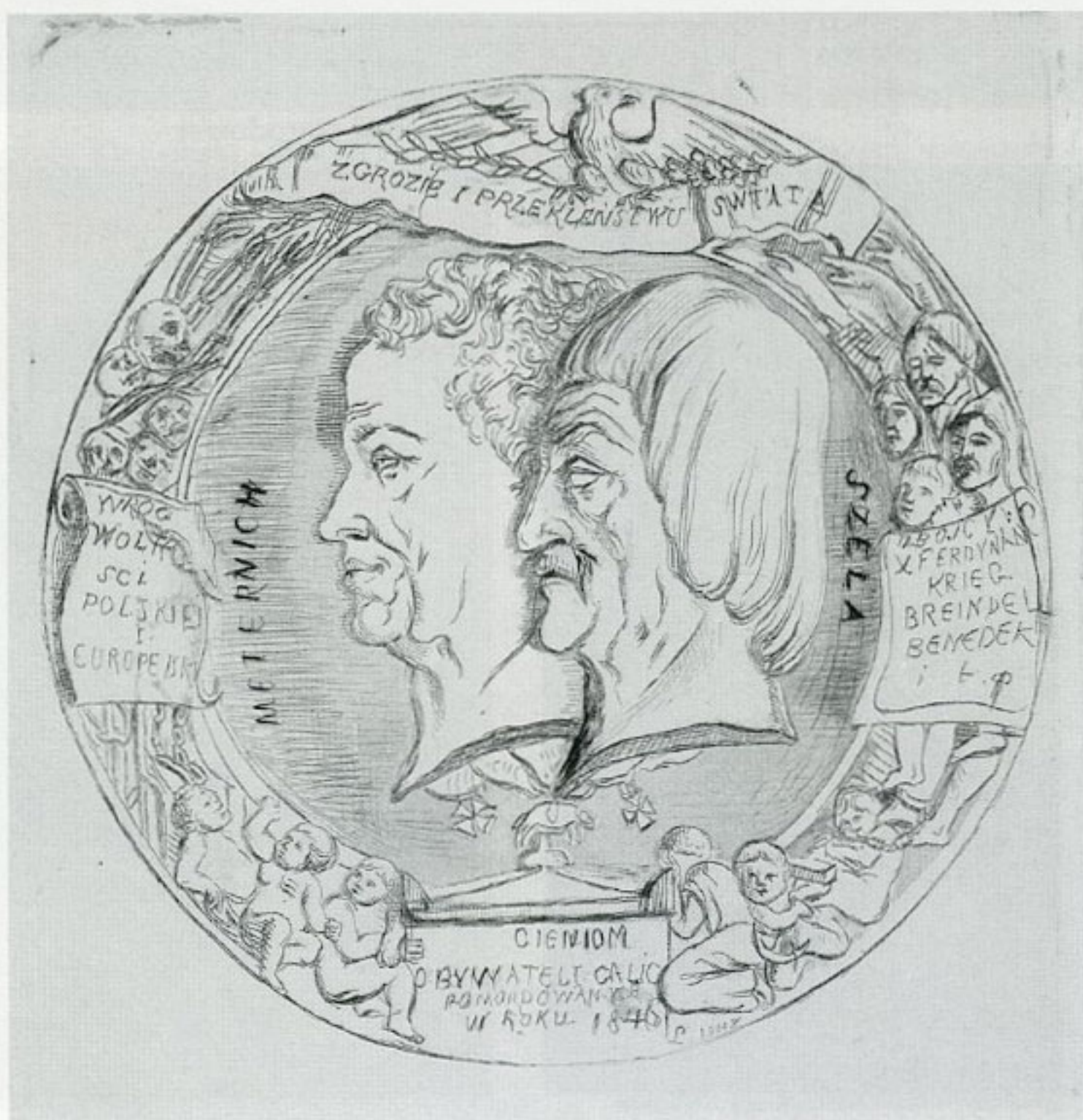
19. Lucjan Siemieński, „Rzeź galicyjska 1846 roku”, 1848, akwaforta, w zbiorach Biblioteki Narodowej