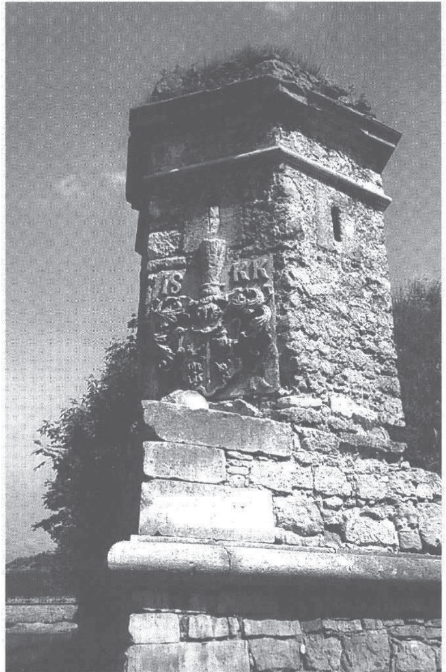
Złoczów. Wieżyczka narożna na wałach złoczowskich. Inicjały w kartuszu: IS KK – Jakub Sobieski, Kasztelan Krakowski.